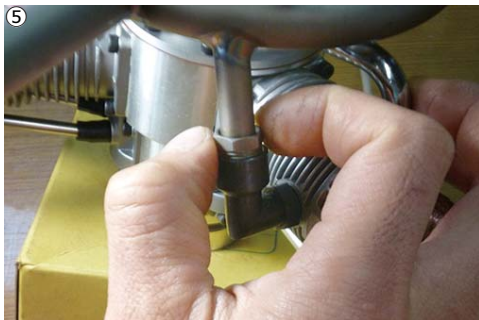
⑤各ナットを指で回せるだけ回してから、スパナで締めこみます。3つを均等に、少しずつ締めこんで下さい。 ⑤Tighten the nuts by fingers until it stops. Then equally tighten up each nut little by little with a spanner.