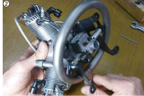
②リングマフラーを下方からくぐらせるようにして、マウント前方に入れます。 ②Insert the muffler from rear to the front of the mounts. First pass the under feet then pass the upper feet.