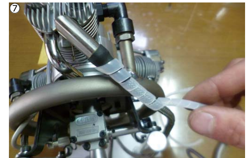
⑦コード類がマフラーに接触する部分には、スパイラルチューブを巻いて熱から保護して下さい。 ⑦Apply spiral tubes to protect the cords where touch the muffler.

チタン製リングマフラーは、ネジつぶれ、割れ等が起こった場合修理が出来ません。取り扱いにはくれぐれもご注意ください！