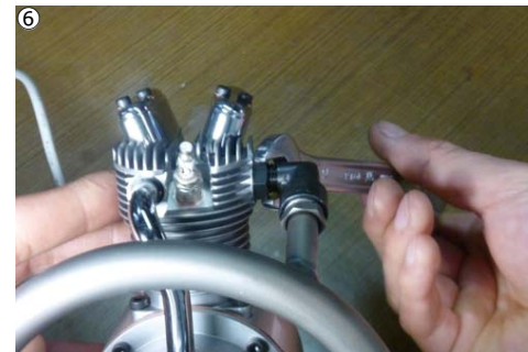
⑥アダプターナットをスパナで締め付けます。 ⑥Tighten adapter nuts for all cylinders.