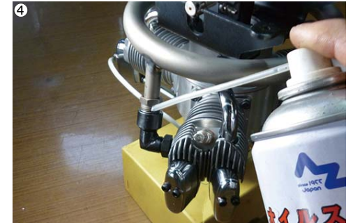
④マフラーナットのネジ部に、潤滑油を注油します。 ④Apply lubricant oil to the thread of the nuts.