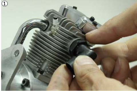
①アダプターのナットを全て緩めておきます。 ①Loose adapter nuts for all cylinders.