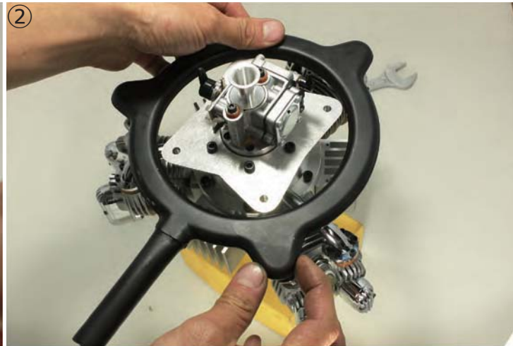
②リングマフラーナットを全てのシリンダーに軽くねじ込みます。3つ全て、指でスムーズに回るように位置を合わせて下さい。無理やりにねじ込むと、シリンダーを破損します。 ②Insert 3 nuts of the ring muffer into each cylinder. Adjust position that all threads can be turned smoothly by your fingers. Never tighten by force, or you may break the cylinders.