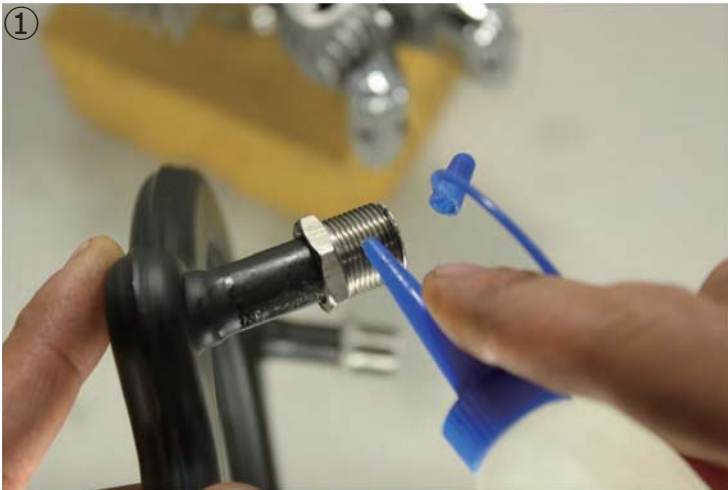
①マフラーナットのネジ部に、潤滑油を注油します。 ①Apply lubricant oil to the thread of the nuts.